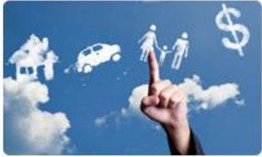
1. Foundation of Financial Planning พื้นฐานการวางแผนการเงินส่วนบุคคล