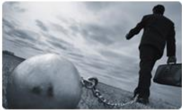
4. Personal Debt Management การจัดการหนี้ส่วนบุคคล