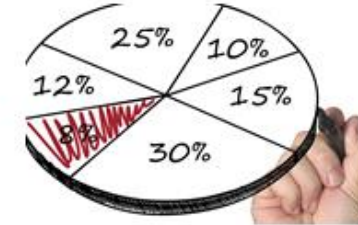
3. Cash & Liquidity Management การบริหารเงินสดและสภาพคล่อง