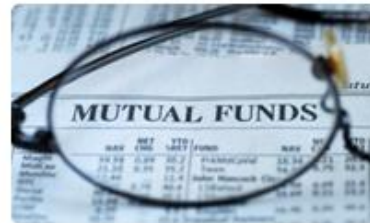
8. Mutual Fund Investment การลงทุนผ่านกองทุนรวม