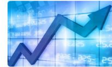
6. Investment Planning การวางแผนการลงทุน