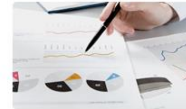
9. Investment Strategy กลยุทธ์การลงทุน