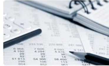
2. Personal Financial Statement งบการเงินส่วนบุคคล