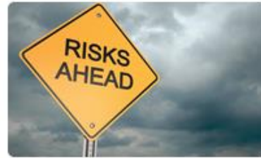
5. Insurance Planning การวางแผนประกันชีวิต/ประกันภัย