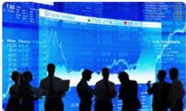
7. Investment Assets สินทรัพย์เพื่อการลงทุน